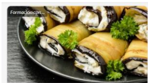
Cocina Sana. Recetas vegetarianas y veganas.